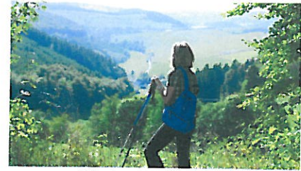
Blick vom Dommel

Start: Besucherzentrum Willingen GPS: N 5117272 O 836373 Ziel: Ortsteil Bömighausen Länge: 31,0 km Höhenmeter: 650 mtr. Orientierung: weißes U auf schwarzen Grund Einkehrmöglichkeit: mehrere am Wege. ÖPNV: AST oder Linienverkehr (nur Mo.-Fr.)